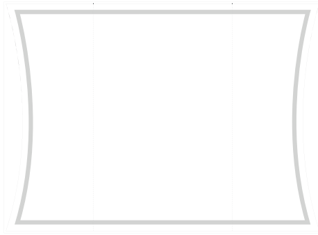
1:1 Vorlage auf Seite 2